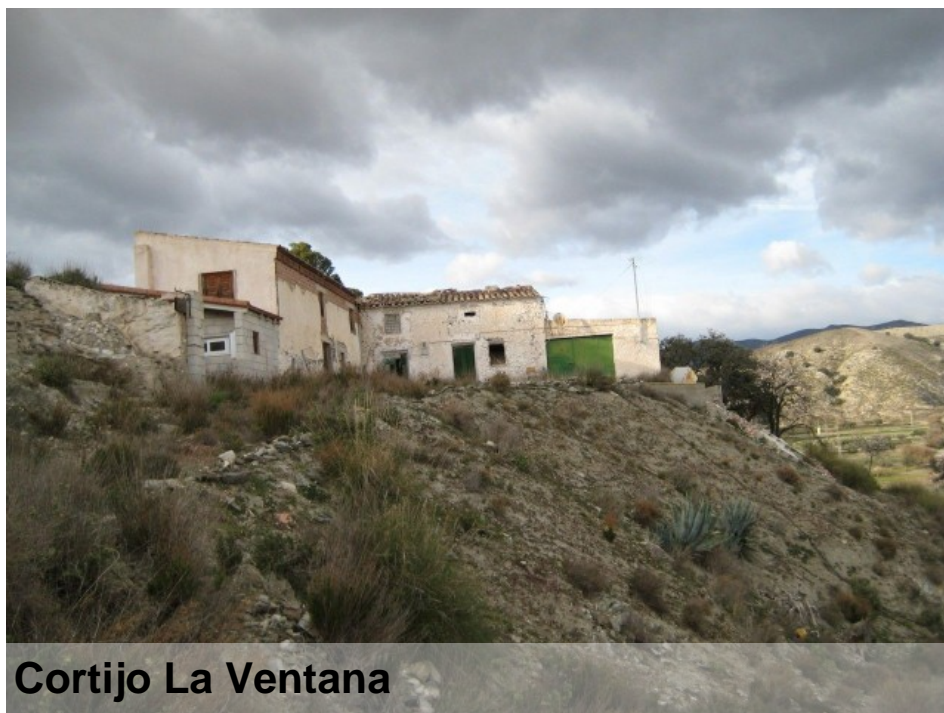
Cortijo La Ventana